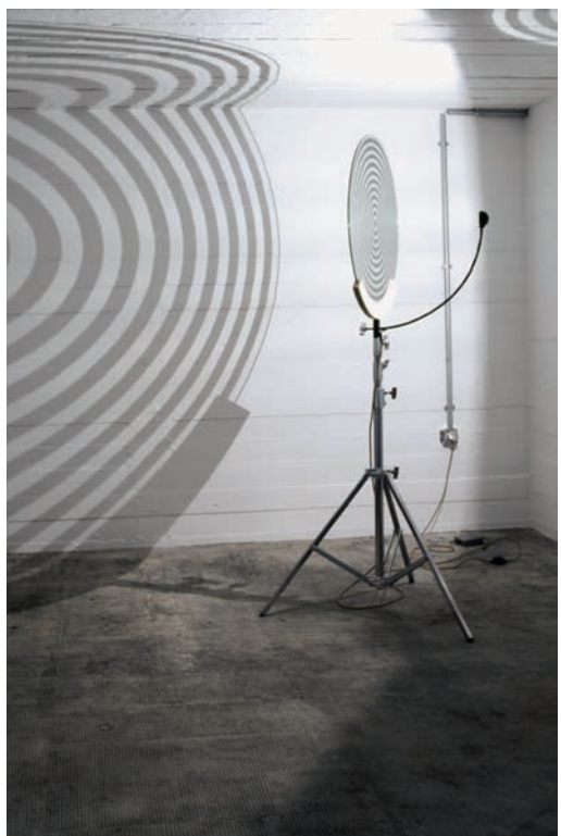
Olafur Eliasson: Shadow projection lamp, 2004, Boros Collection, Berlin.