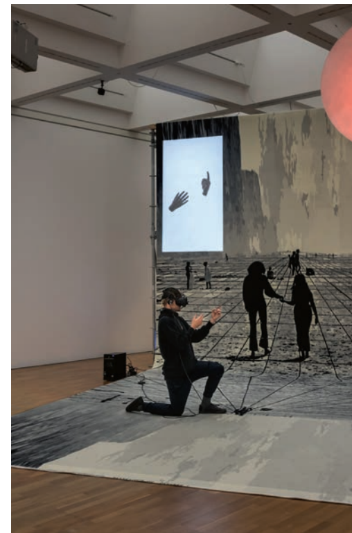
Florian Meisenberg: Pre-Alpha Courtyard Games (raindrops on my cheek) , 2017, courtesy der Künstler. © 2023: der Künstler.

Workshops für Kinder So, 6. Juli und 27. Juli 2023 Museum unter Tage Jeweils von 10–13 Uhr