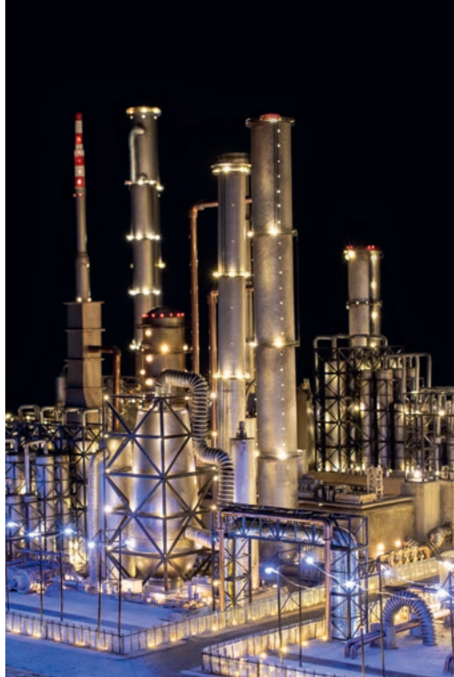
Monira Al Qadiri: Crude Eye , 2022, courtesy die Künstlerin. © 2023: die Künstlerin. Foto: courtesy die Künstlerin

Die Besucher*innen werden von diesen Atmosphären eingefangen und bewegen sich dennoch frei im Raum. Mit jeder Bewegung nehmen sie eine neue Perspektive ein, die auf die Arbeiten antwortet und sie zugleich erst hervorbringt. Auf diese Weise verflüssigen sich die Grenzen des Kunstwerks. Es verbindet sich mit den Rezipierenden zu einer flüchtigen Situation. Die neuen Umgebungen absorbieren in hohem Maße die Aufmerksamkeit der Besucher*innen, ohne sie dabei zu überwältigen. Stattdessen sind sie sich voll und ganz darüber im Klaren, wie das Werk konstituiert ist und wie es im Raum aufgebaut wurde. Sie sind jederzeit in der Lage, aus der Umgebung bereichert und selbstbestimmt wieder aufzutauchen.