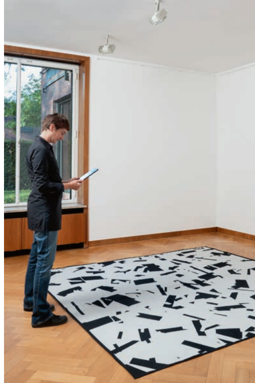
Banz & Bowinkel: Bots 05 , 2019, Kunstmuseen Krefeld. © 2023: Banz & Bowinkel, Foto: Dirk Rose, Köln

ISBN 978-3-99153-009-1, 200 S., 34 Euro im Buchhandel, 29 Euro an der Museumskasse