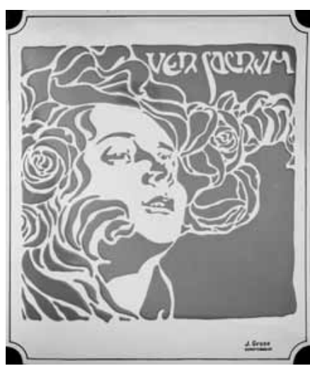
Emailliertes Schild mit Titelblatt-Motiv der Zeitschrift VER SACRUM. Entwurf: Koloman Moser, um 1899. Ausführung J. Gross, 1915, 40 x 30 cm.

Besichtigung: 29. November – 2. Dezember 2013, 11.00 – 18.00 Uhr