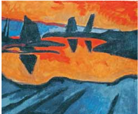
Mit bis zu 1,5 Millionen Euro taxiert: Karl Schmidt-Rottluffs „Watt bei Ebbe“ (1912).

Cologne Fine Art, bis 24. November, Köln. www.colognecfineart.de