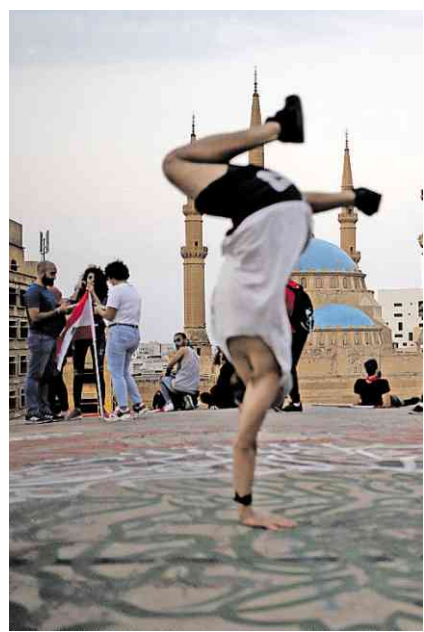
Breakdance auf dem Kinodach

Demonstranten sitzen auf dem Dach des früheren Kinos und schwenken ihre Fahnen. Straßenhändler verkaufen gegrillte Maiskolben und Fladenbrote.