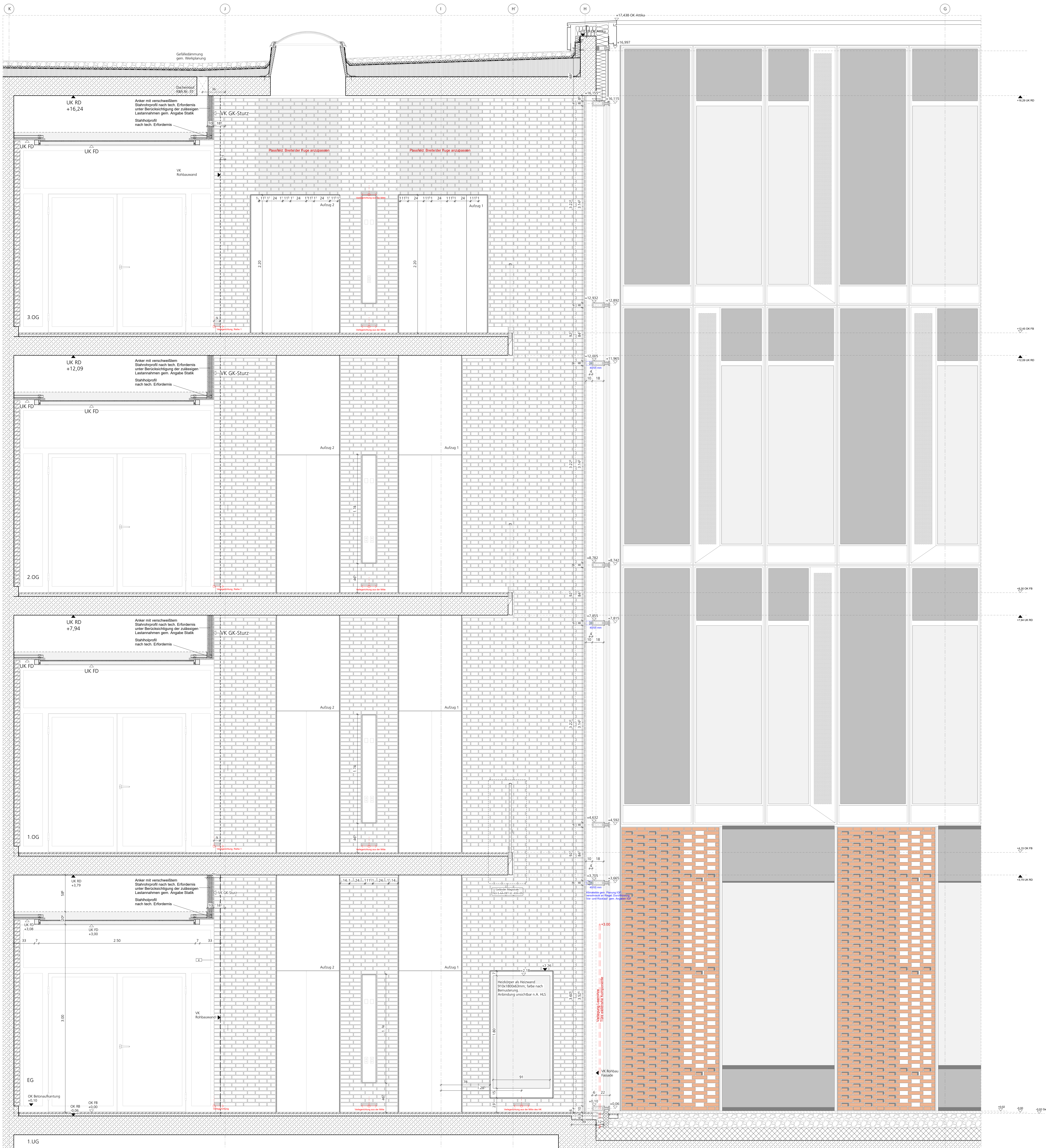
Ausschnitt, M 1:20