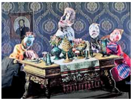
Der reiche Bauer Fortunatus Wurzel und seine Saufkumpagne.

Nichts von all dem gelingt der Nürnberger Truppe um Joachim Torbahn und Tristan Vogt. Thalias Kompagnons sind durch aus renommiert, werden häufig zu Festi-