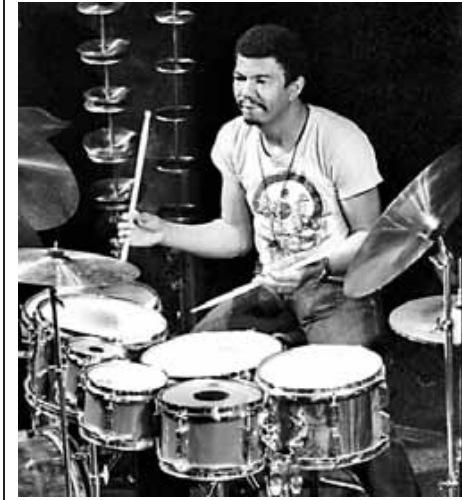
Umspielen, andeuten, nuancieren: Jack DeJohnette 1980.

Ob spontan, aus dem Moment heraus improvisierte Jazzplatten zeitlose Qualität haben, das hängt sehr von ihrem Groove ab. DeJohnette hatte ihn und so wurde er der transatlantische Meistertrummer par excellence – von 1970 an wollte im Grunde jeder mit ihm spielen. Scheuklappen hatte er dabei nie, er konnte in Chicago an der South Side den Blues und im Musikerkollektiv AACM reinsten Free Jazz spielen.