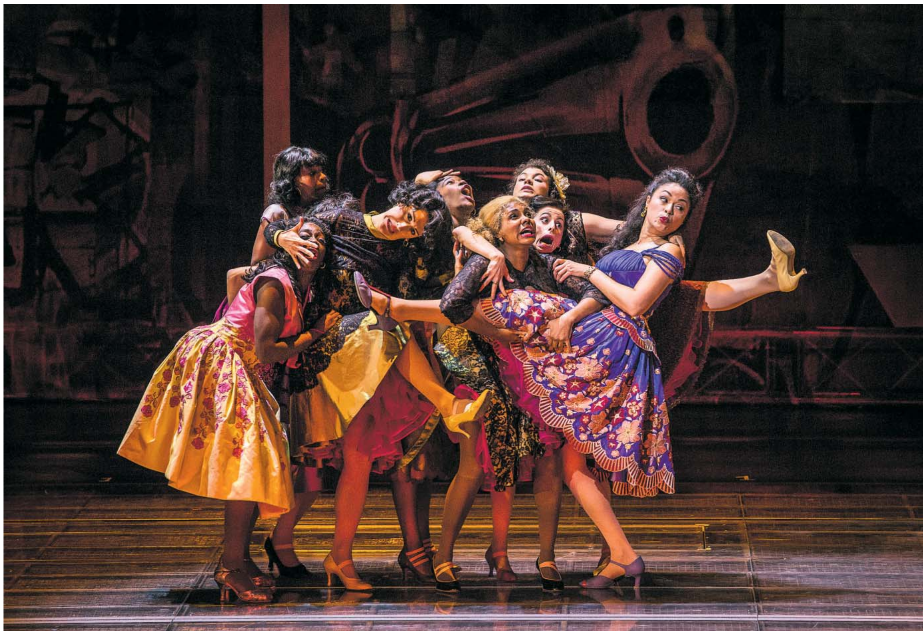
Wie jung wir mal waren und wie alt wir jetzt sind: „West Side Story“ mit einer neuen Geschichte der „gereiften“ Maria