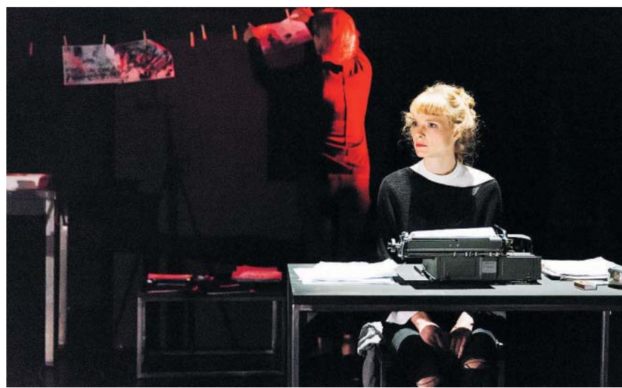
Geschichte wiederholt sich: München rekonstruiert den Genozid.